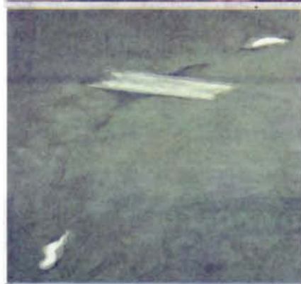
Boven 'Cinema #3', onder 'Underground second floor', beide van Guy Van Bossche.